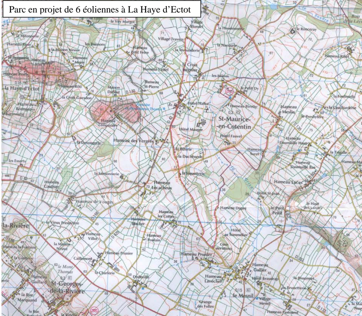
Parc en projet de 6 éoliennes à La Haye d'Ectot